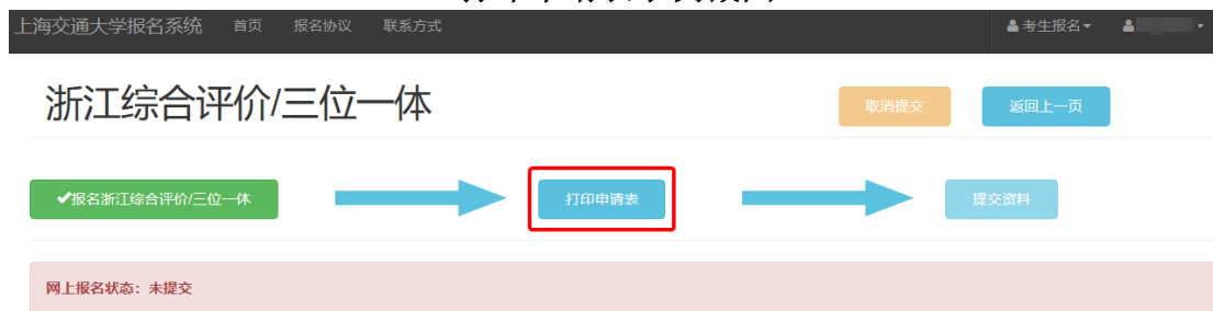
打印申请表示例截图