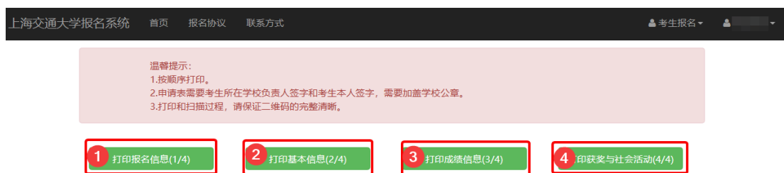
打印申请表完成示例截图